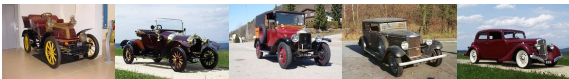
1898 Georges Richard 1908 C7 Roadster 1923 L2N Boulangère 1928 H3 Reihen-8-Zyl 1935 U4B

2010 wurde die Halle gebaut damit die Marke UNIC nicht in Vergessenheit gerät. Zur Sammlung gehören folgende Automobile und Lastwagen: